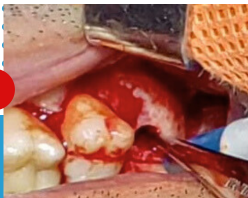
CIRUGÍA DE CAVITACIÓN